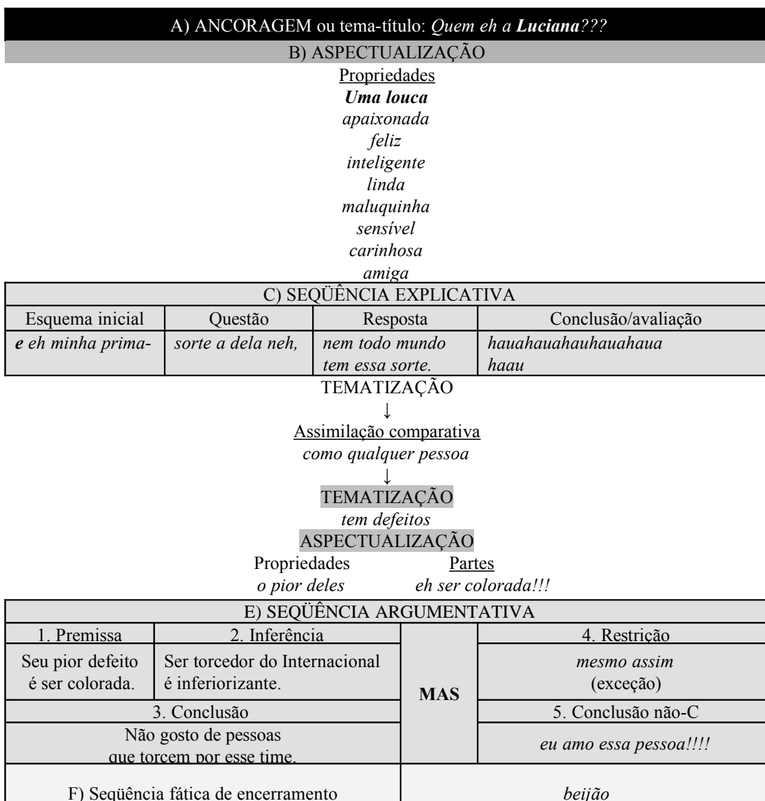
Esquema 2. Organização seqüencial do exemplo 3

Vejamos a organização seqüencial do texto 3, representada no esquema 2: