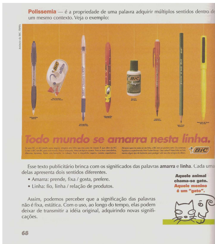
Figura 2. Livro didático Novo Diálogo (2006)

Na página reproduzida do livro didático, a polissemia é abordada de forma a despertar o interesse do aluno, pois apresenta esse fenômeno através da propaganda, o que instiga, muitas vezes, a curiosidade do aluno, já que esse é um fator do cotidiano de todos. Na propaganda do livro a questão do contexto também recebe evidência, pois é importante ressaltar que a frase “ Todo mundo se amarra nesta linha ” possui mais de um significado, porém da forma como ela é posta no livro, dentro do contexto daquela propaganda, seu significado se reduz a apenas um sentido.