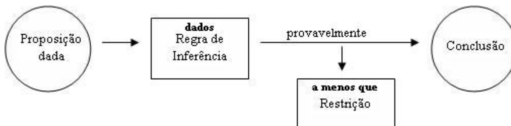
Esquema 2, baseado em Adam (1997, p.108)

é dada como verdade caso não houver um fato que a refute, como pode ser observado no esquema (2) em que há lugar para a restrição .