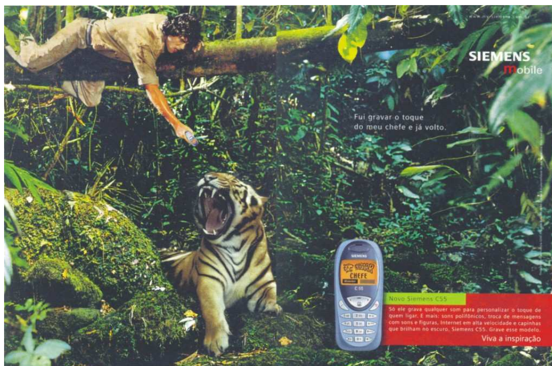
Fig. 2 – Anúncio com representação masculina.